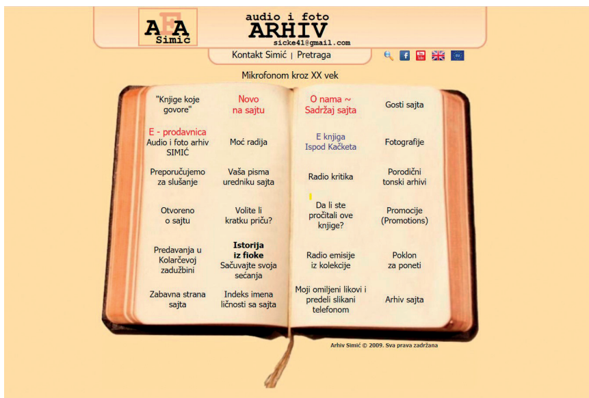
Почетна страна сајта Аудио и фото архив Симић http://www.audiofotoarhiv.com/